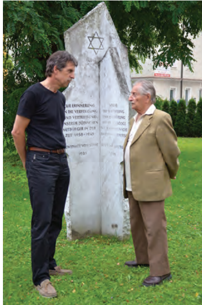
Marco Feingold: „Meine Augen haben gesehen, was niemand je sehen sollte.“

Der Busfahrer hatte an diesem Vormittag leider keine Zeit mit uns die Synagoge zu besuchen, doch ich habe ihm in kurzen Sätzen etwas aus dem Leben von Herrn Feingold erzählt. Ein unglaubliches Leben, das am 19.09.2019, im Alter von 106 Jahren endete. Herr Feingold war Präsident der Israelitischen Kultusgemeinde in Salzburg, hat vier Konzentrationslager überlebt und war Österreichs ältester Holocaust-Überlebender. Den größten Teil seines Lebens, über siebzig Jahre, widmete er der Aufklärung des Holocausts und der Nazi-Diktatur. Bis fast zum Ende seines Lebens erinnerte er stetig an dieses dunkle Kapitel der österreichischen und deutschen Geschichte. So oft es ging, erzählte er in Vorträgen, Interviews und Diskussionsrunden von seinem Überleben im Nationalsozialismus und Konzentrationslagern. Herr Feingold ist vor tausenden von Schulklassen gestanden und wurde nicht müde zu warnen, zu erinnern und zu erzählen – von einer Zeit, die wir nur aus Geschichtsbüchern kennen, die in seinen Augen noch immer nicht alles zur Gänze und wahrheitsgetreu wiedergeben hat. Gleich nach dem 2. Weltkrieg hat er als Leiter