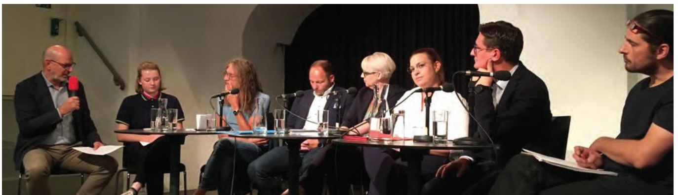
Podiumsdiskussion mit Kandidat*innen zur NR-Wahl